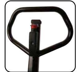
El timón ergonómico asegura al usuario un manejo cómodo. El timón se puede marcar con el nombre de la empresa/departamento.