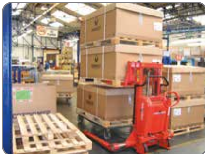
Construcción robusta que asegura una larga vida operativa y bajo coste de mantenimiento.